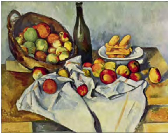
Paul Cézanne «Korv õuntega» Paul Cézanne «The basket of apples» Поль Сезанн «Корзина с яблоками»