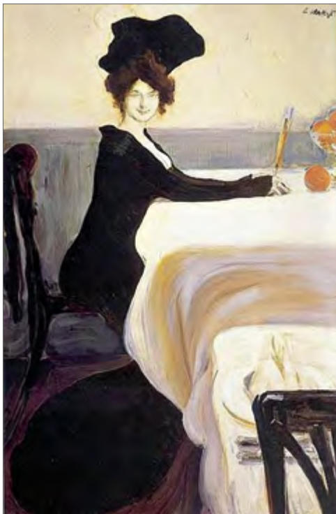
Lev Bakst «Õhtusöök» Leon Bakst «Supper» / Лев Бакст «Ужин»