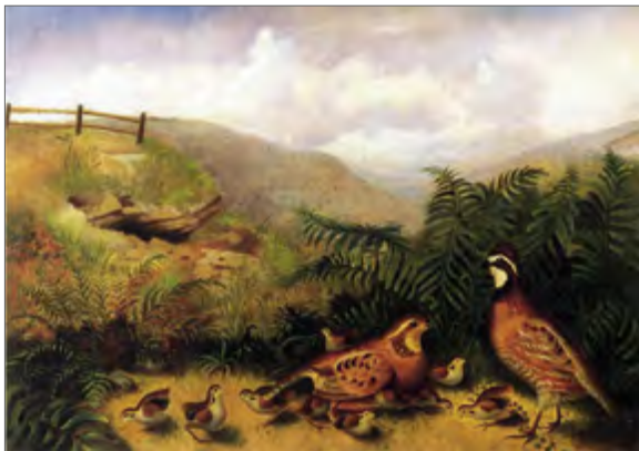
Rubens Peale «Maastik vutiga» Rubens Peale «Landscape with quail» Рубенс Пил «Пейзаж с перепёлкой»