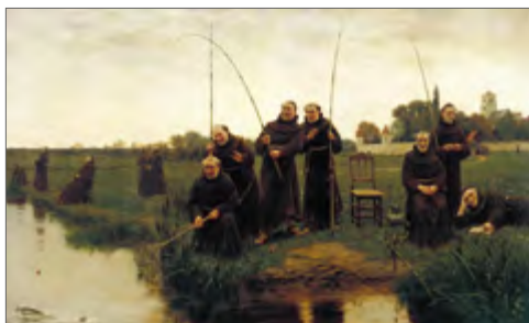
Walter Dendy Sadler «Neljaräev» Walter Dendy Sadler «Thursday» Уолтер Денди Садлер «Четверг»