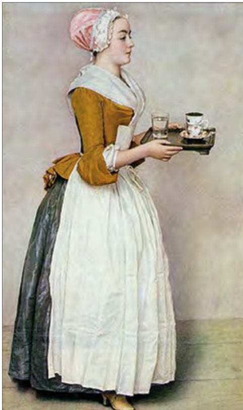
Jean-Étienne Liotard «Šokolaadineiu» Jean-Étienne Liotard «The Chocolate Girl» Жан Этьен Лиотар «Шоколадница»