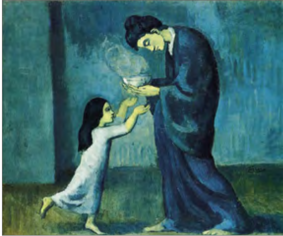
Pablo Picasso «Supp» Pablo Picasso «Soup» Пабло Пикассо «Суп»

Maguskartuli-porgandisupp Fetajuustu-spinati profitroolid / vürtside segu