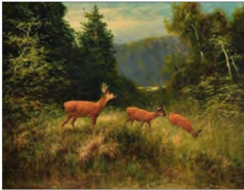
Otto Scheuerer «Hirv legendikul» Otto Scheuerer «Deer on a clearing» Отто Шойерер «Олень на поляне»