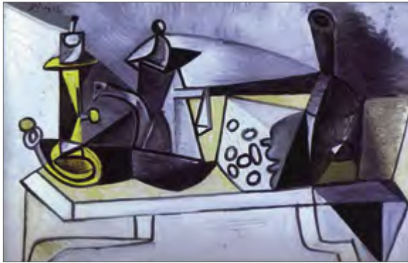
Pablo Picasso «Vaikelu juustuga» Pablo Picasso «Still life with cheese» Пабло Пикассо «Натюрморт с сыром»