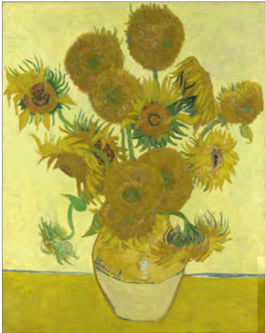
Vincent Van Gogh «Päevalilled» Vincent Van Gogh «Sunflowers» Винсент Ван Гог «Подсолнухи»