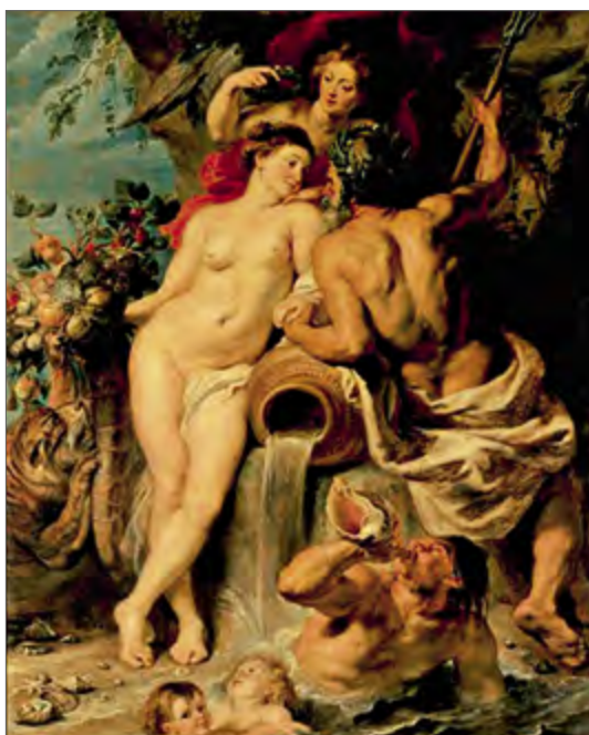
Peter Paul Rubens «Maa ja vee liit» Peter Paul Rubens - The union of earth and water Питер Пауль Рубенс «Союз земли и воды»