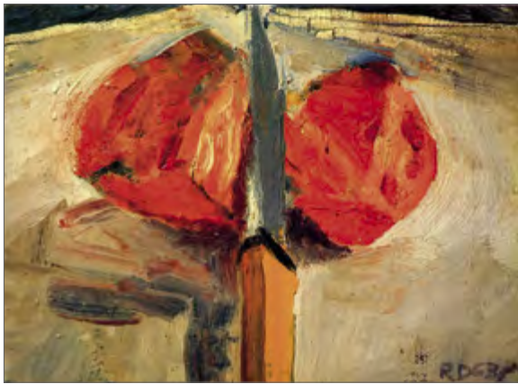
Richard Diebenkorn «Tomat ja nuga» Richard Diebenkorn «Tomato and knife» Ричард Дибенкорн «Томат и нож»