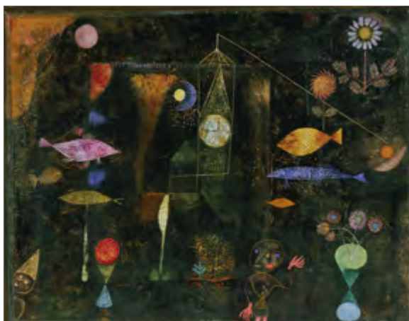
Paul Klee «Maagiline kala» Paul Klee «Fish Magic» Пауль Клее «Магия рыб»