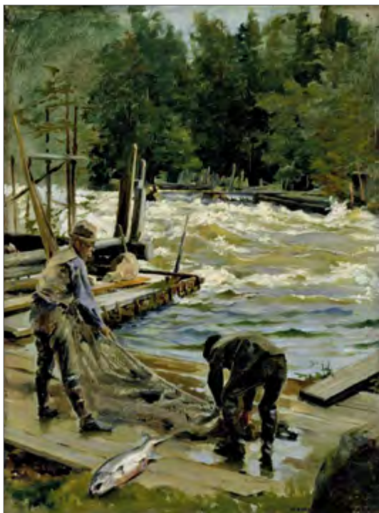
Gunnar Berndtson «Lõhepüük» Gunnar Berndtson «Salmon fishing» Гуннар Берндтсон «Ловля лосося»