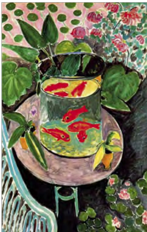
Henri Matisse «Kuldkalad» Henri Matisse «The goldfish» Анри Матис «Красные рыбки»