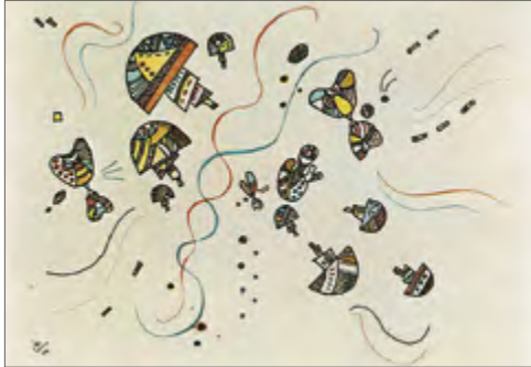
Wassily Kandinsky «Viimane akvarell» Wassily Kandinsky «Last watercolour» Василий Кандинский «Последняя акварель»