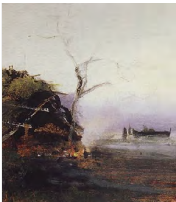
Aleksei Savrasov «Tuli jõe ääres» Alexei Savrasov «Bonfire on the river» Алексей Саврасов «Костёр у реки»