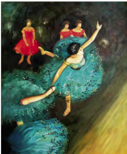
Edgar Degas «Tantsija rohelistes» Edgar Degas «The green dancer» Эдгар Дега «Танцовщица в зеленом»